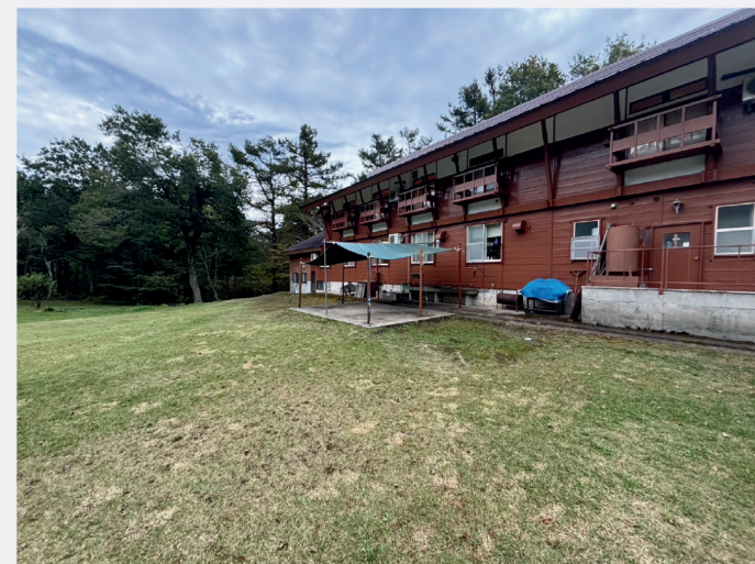
池の平青少幼年センター