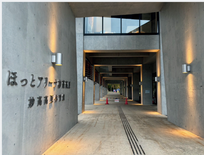
ほっとアリーナ妙高高原

2日目のお迎えの際は、裏面スケジュール到着時刻の15分前を目安にお迎えをお願い致します。